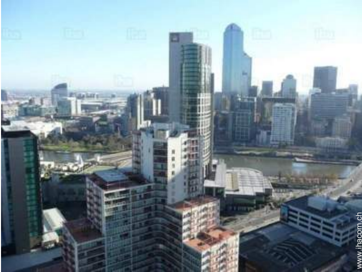
Blick auf Fluss