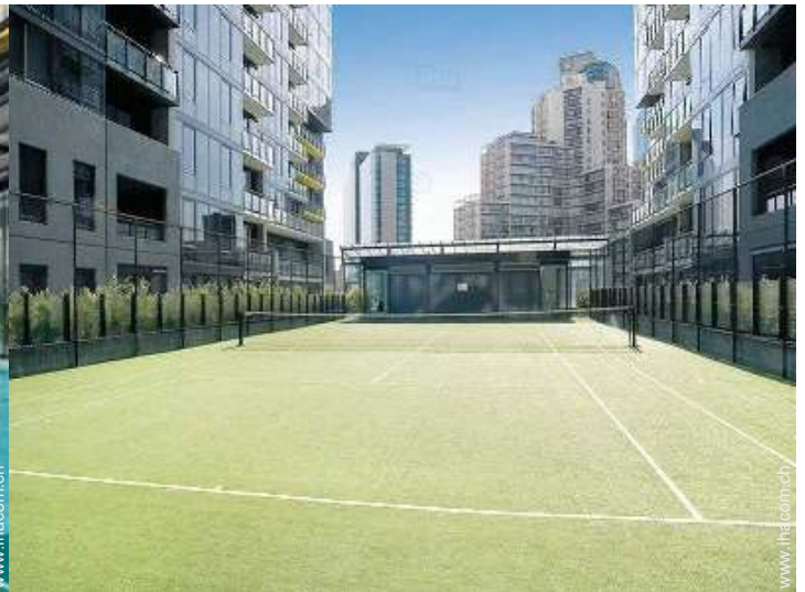
Tennisplatz - synthetischer Belag