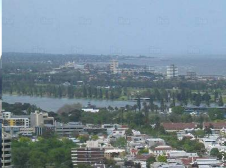
Blick auf See