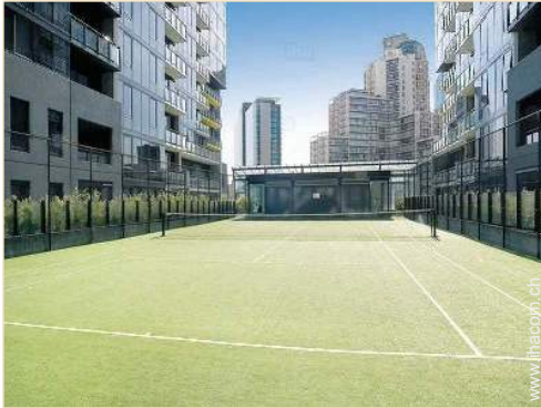
Tennisplatz - synthetischer Belag