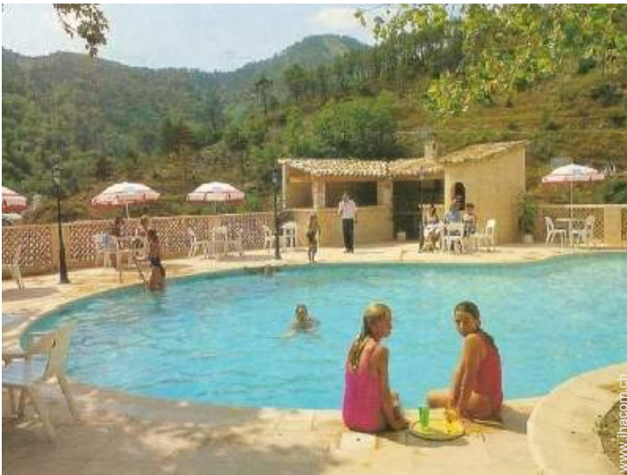
Swimmingpool in Wohnanlage