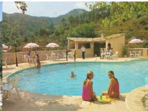
Swimmingpool in Wohnanlage