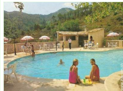
Swimmingpool in Wohnanlage

Skipisten 40km Skilifte 40km Meer/Ozean 40km Sandstrand >50km Kiesstrand 40km Fluss 10km See 40km Wald 2km Bergmassiv 30km Via ferrata (Klettersteig) 15km