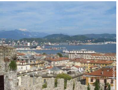
Blick auf Stadt