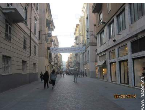
Blick auf Stadtzentrum