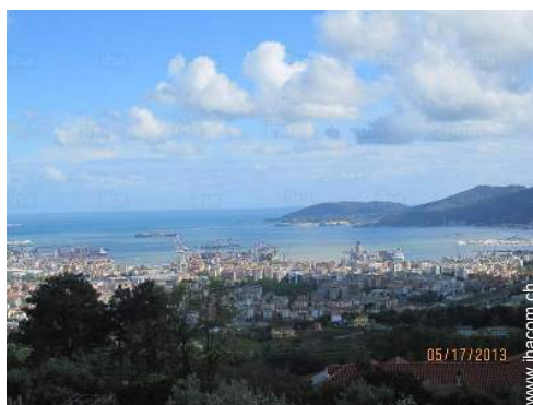
Blick auf Stadt