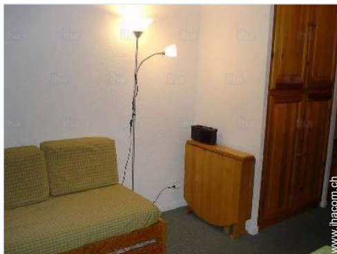
Schrankbett(en) 2 Personen