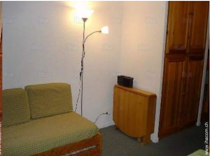
Schrankbett(en) 2 Personen